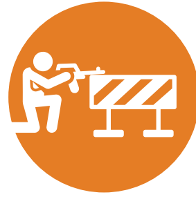
1 عملية لإطلاق نار على حاجز قلنديا