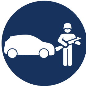
1 عملية دهس واحدة