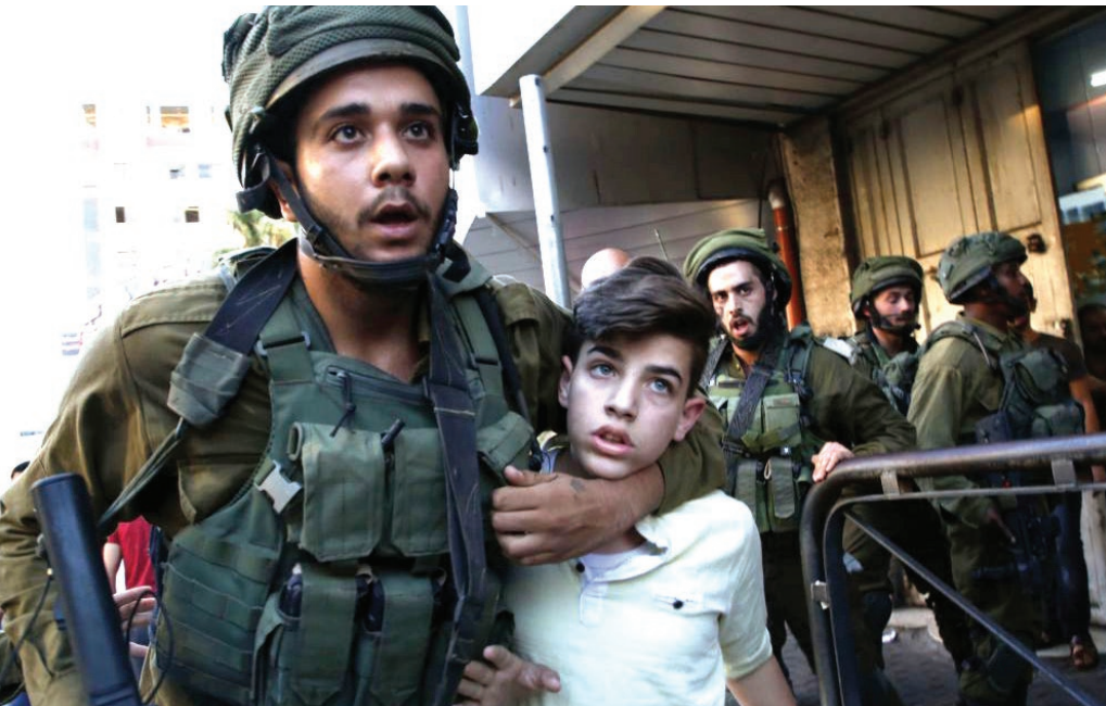
نموذج لاعتقال الأطفال من قبل جنود الاحتلال

وتتعامل قوات الاحتلال مع الأطفال المعاملة ذاتها التي يتلقاها الأسرى الفلسطينيون، فهي تعتقل الأطفال المرضى والفتيات القاصرات، وتمارس بحقهم اعتداءات جسدية ونفسية مختلفة، تبدأ بتعرضهم للضرب المبرح فور اعتقالهم، ونقلهم في الآليات العسكرية تحت الضرب المستمر والشتائم، وصولاً إلى مراكز التحقيق، حيث يتعرض الأطفال لأبشع أنواع التعذيب. ولا تقف انتهاكات الأطفال عند هذا الحد، بل تقوم سلطات الاحتلال بتغريم ذوي الأطفال مبالغ مالية كبيرة، وبحسب هيئة شؤون الأسرى والمحررين بلغت مجموع الغرامات المالية التي فرضتها سلطات الاحتلال على الأطفال المعتقلين خلال شهر تشرين أول/أكتوبر 2017 نحو 78 ألف شيكل، أي ما يعادل 21430 دولاراً أمريكياً 3 .