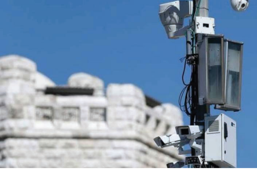
نشر أجهزة المراقبة المتطورة في شوارع القدس المحتلة

تعمل شرطة الاحتلال على فرض رقابة مشددة في أزقة القدس المحتلة، حيث بدأت شرطة الاحتلال بتريكب أجهزة تنصت فائضة الحساسية وصلت تكلفة الواحدة منها إلى نحو 100 ألف شيكل، وتهدف هذه الأجهزة بحسب وسائل إعلام عبرية إلى «تشخيص أحداث غير عادية بشكل فوري، وأضافت بأن هذه المنظومة قادرة على تمييز أصوات الانفجارات، وإطلاق النار. وسوف يتم