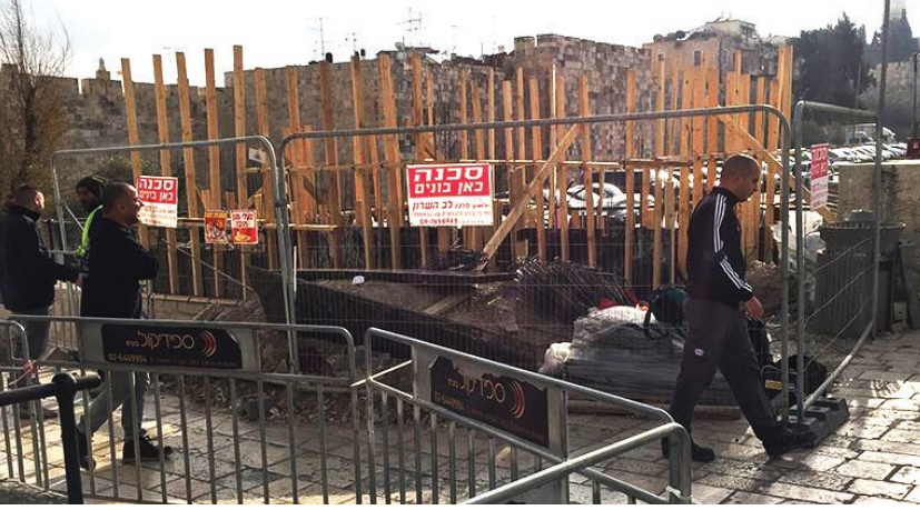
أعمال البناء في منطقة باب العمود

في إطار فرض مزيدٍ من القيود في البلدة القديمة وتشديد قبضة شرطة الاحتلال الأمنية، وكون منطقة باب العمود من أكثر مناطق القدس التي شهدت عمليات فردية، بدأ الاحتلال بتنفيذ خطة تهيؤيّة ضخمة ذات أبعاد أمنية في المنطقة، وقد أعلن عنها وزير الأمن الداخلي في