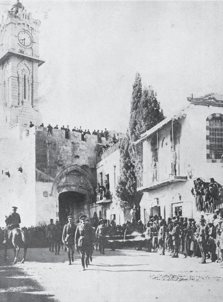
الجنرال اللنبي يدخل القدس

في 9/12/1917 احتل الجيش البريطاني القدس، وفي 11/12/1917، دخل الجنرال اللنبي إلى المدينة عبر بوابة يافا (بوابة الخليل) محتلاً غاصباً معلناً