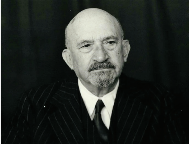
حاييم وايزمان أول رئيس اسرائيلي

خطّ الاحتلال البريطاني أول مسار التهويد في القدس، ليسهل على الصهاينة لاحقاً السير في هذا المضمار حيث استندت سياستهم التهودية التي نراها ممتدة حتى يومنا هذا إلى ما فعله البريطانيون عقب احتلالهم للقدس. ففي 1918/4/27 عقدت الحكومة البريطانية اجتماعاً في دار الحكومة البريطانية بالقدس بقيادة الحاكم العسكري ستورز الذي قدّم حاييم وايزمان (رئيس المنظمة العالمية من 1920 إلى