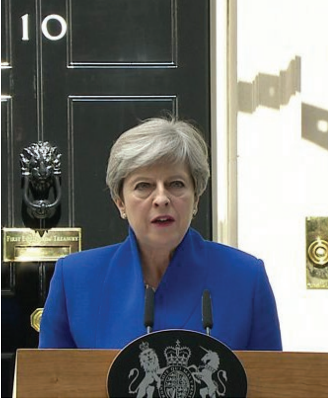
رئيسة وزراء بريطانيا تيريزا ماي

فهي "تظهر الدور الحيوي الذي قامت به بريطانيا في إقامة وطن للشعب اليهودي". وهو الأمر الذي كررته في 2017/11/2 في احتفال كبير في لندن بمئوية وعد بلفور حضره رئيس حكومة الاحتلال بنيامين نتنياهو.