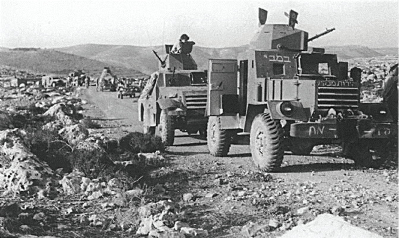
صورة للقوات الصهيونية إبان حرب عام 1948

في أثناء الاحتلال البريطاني سجل لفلسطين تعاون ملحوظ بين الجانب العسكري البريطاني والعصابات الصهيونية، سواء في تدريب هذه العصابات على القتل، أو دعمها في عمليات القتل والاعتداء على العرب. وبرز في هذا السياق بشكل خاص اللورد أورد وبنجت الذي تحالف مع السياسيين الصهاينة بعدما تراءى له أن إنشاء دولة يهودية في فلسطين هو مهمة دينية، وهو صرّح بأنه درس الدراسات العسكرية ليكون مفتاح النصر النهائي للصهيونية. تواصل وبنجت مع الوكالة اليهودية سعياً إلى تحقيق تعاون بريطاني-صهيوني لتنفيذ عمليات مشتركة ضد الثوار العرب، وقد اقترح العقوبات الجماعية ضد القرى العربية بأكملها وترحيل أهلها إلى شرق الأردن وتسليم أراضيهم إلى الصندوق القومي اليهودي في حال تنفيذ هجوم منها ضدّ مستوطنة صهيونية، والتقى كذلك، مع مسؤولي الوكالة اليهودية، بعصابات تهريب السلاح، وأمّنوا لها المال والدعم. وكان وبنجت وراء تقديم مقترح إلى الحكومة البريطانية بتأسيس وحدات ليلية خاصة، وعمل على تدريب خفراء يهود، مستعيناً بعدد من الضباط