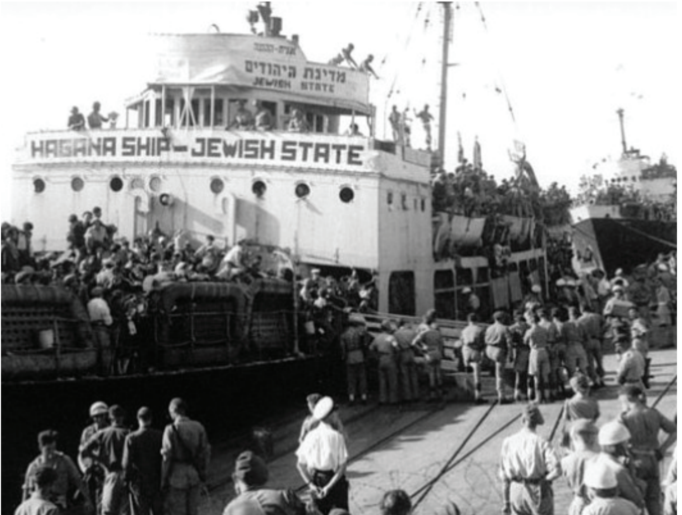
نموذج من الهجرة اليهودية إلى فلسطين

بدأ الصهاينة بتهويد القدس قبل الإعلان عن إقامة "دولة إسرائيل" فعلياً في عام 1948، ضمن عملية تتم تحت عين الاحتلال البريطاني وبرعايته. وكان الهدف المعلن لحكومة الاحتلال البريطاني تحقيق وعد بلفور، بما يعنيه من فتح باب الهجرة اليهودية إلى فلسطين وتأسيس وطن قومي لليهود فيها. وعلى الرغم من أن "موجات" الهجرة اليهودية إلى فلسطين كانت سابقة على هذا الاحتلال إلا أنها تزايدت وتعاظمت في ظلّه. ووفق المؤرخ البريطاني آرنولد توينبي فإنّ بريطانيا منذ عام 1918 سمحت بالدخول إلى فلسطين سنة بعد سنة لحصة من المهاجرين اليهود، وما كان من الممكن لهؤلاء المهاجرين أن يدخلوا لو لم تكن تحميهم أسوار بريطانية شائكة.